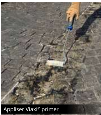
Appliser Viaxi® primer