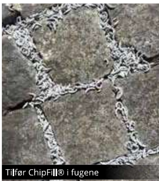
Tilfør ChipFill® i fugene